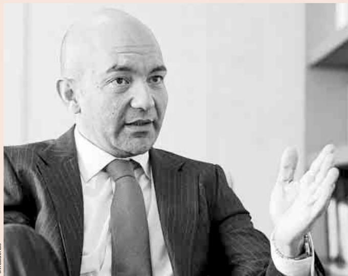
El secretario de Estado de Comercio, Jaime García-Legaz.

En toda España ya hay alrededor de 420 zonas de especial afluencia turística, de las cuales casi 100 se concentran