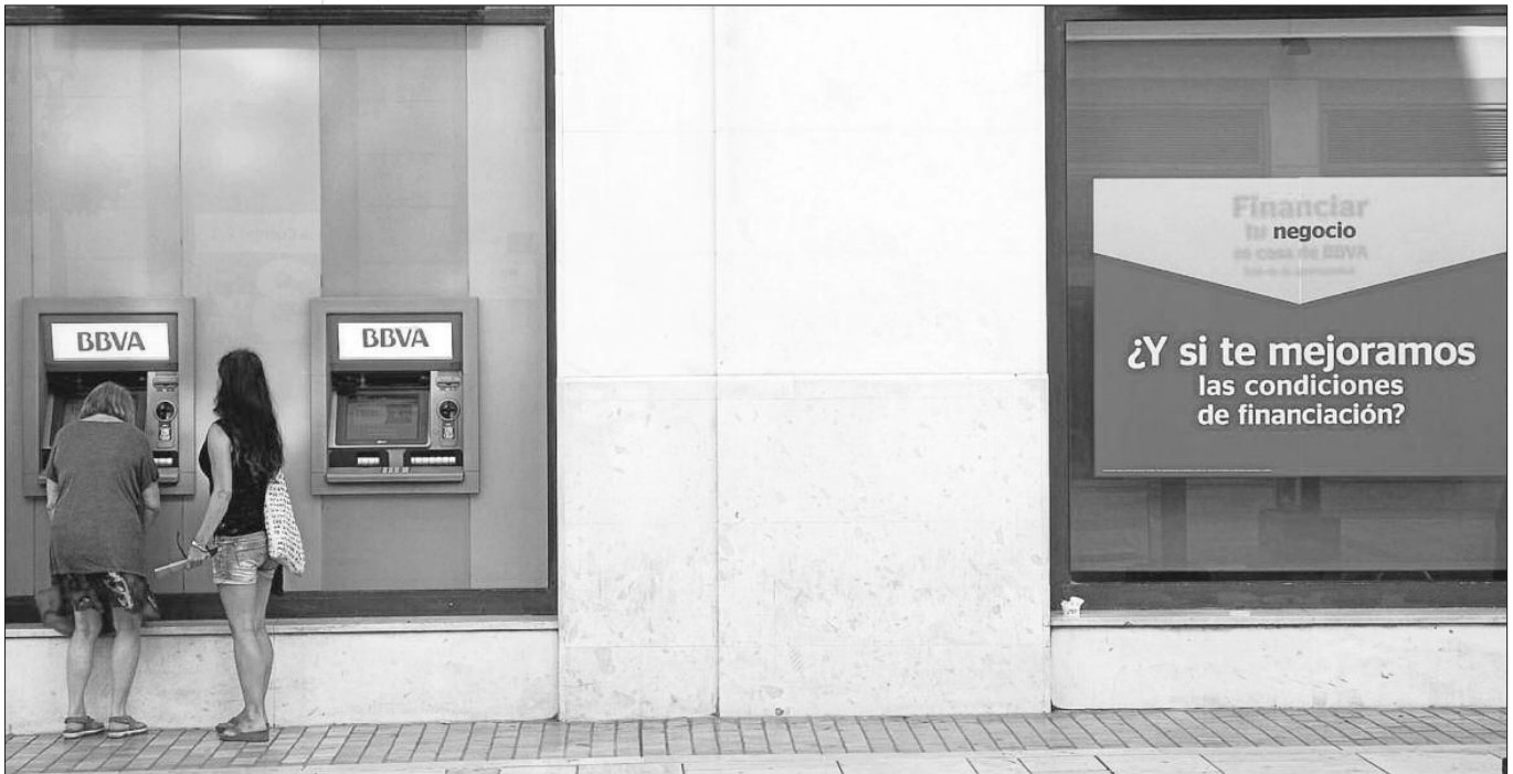
Dos mujeres en un cajero de una entidad bancaria situada en el Centro de la capital malagueña.