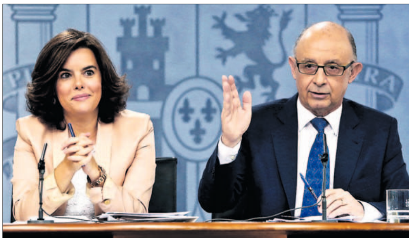
La vicepresidenta del Gobierno, Soraya Sáenz de Santamaría, y el ministro de Hacienda, Cristóbal Montoro.

La intención del Gobierno es que el incremento de los pagos fraccionados se aplique ya este mes y, por ello, el decreto-ley se publicó el viernes en un BOE extraordinario. La norma deberá ser convalidada por el Congreso de los Diputados en el plazo de 30 días. En cualquier caso, su aplicación es inmediata. En el caso de que no se obtuviera el visto bueno