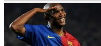
Piden diez años de cárcel para Samuel Eto'o por fraude fiscal