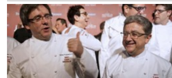
Gobierno y Generalitat cocinan a fuego lento su acercamiento