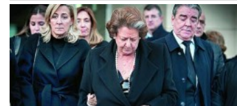
'Rita ha muerto de pena y la aportación fundamental la han tenido los suyos'