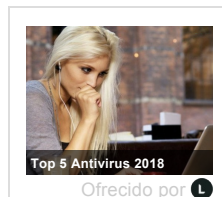
Top 5 Antivirus 2018

En la misma línea, el secretario de Estado también declaró que tampoco "habrá ningún problema para que los pensionistas cobren sus pagas extra puntualmente". Además, explicó que de los 20.000 millones que ingresan las administraciones, aproximadamente la mitad se utilizan en reducir el déficit y 5.000 millones van a asegurar las pensiones, quedando otros 5.000 millones para incrementar el conjunto del resto de gastos.