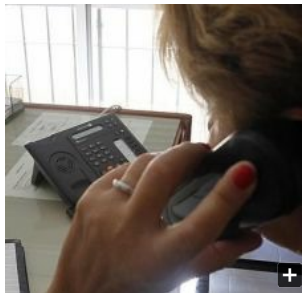
Apoyo unánime al canal de la CNMV para denunciar abusos de mercado

Usuarios financieros y expertos en mercados califican de «positivo y necesario» el nuevo canal que la CNMV ha abierto para denunciar infracciones y abusos en los mercados con el objetivo de minimizar el daño a los inversores y contribuir a la transparencia de las transacciones financieras.