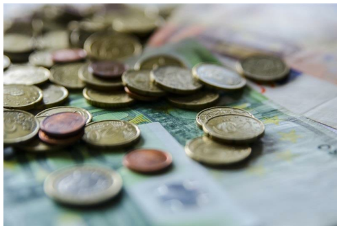
Monedas, euros, billetes, dinero

Así se desprende del Observatorio Financiero del CGE correspondiente al mes de marzo, que destaca que el comienzo del 2018 ha sido "muy esperanzador", puesto que "siguen sin notarse los efectos de Cataluña y parece continuar la inercia del cierre 2017", con un crecimiento anual del 3,1%.