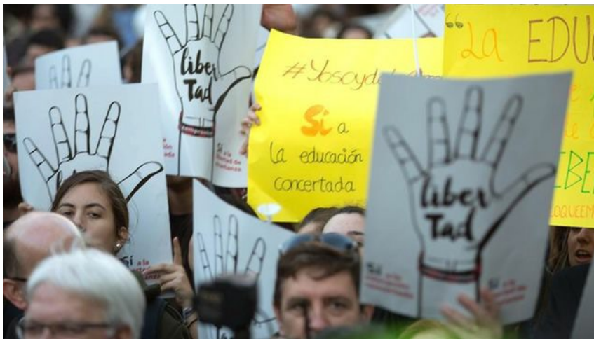
Colegios concertados: donaciones vs actividades complementarias

La educación concertada parece que se ha convertido en un caballo de batalla entre el Gobierno socialista y partidos como PP y Ciudadanos, que le acusan de poner trabas a estos centros y provocar "incertidumbre" entre las familias que optan por ellos para la educación de sus hijos.