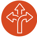
CUESTIONES SOBRE SU APLICABILIDAD