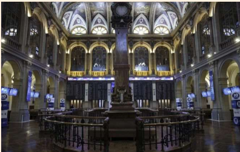
Vista de la Bolsa de Madrid.