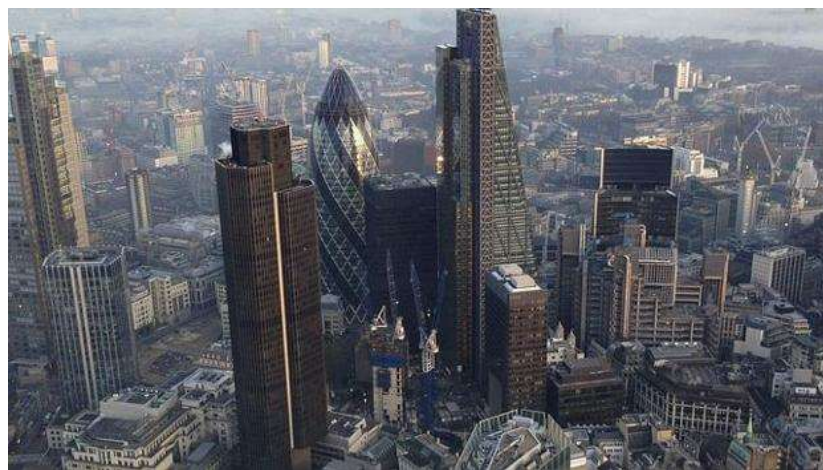
Imagen aérea de la City de Londres

S.E. / Madrid 27/01/2017 01:44h - Actualizado: 27/01/2017 01:47h. Guardado en: Economía