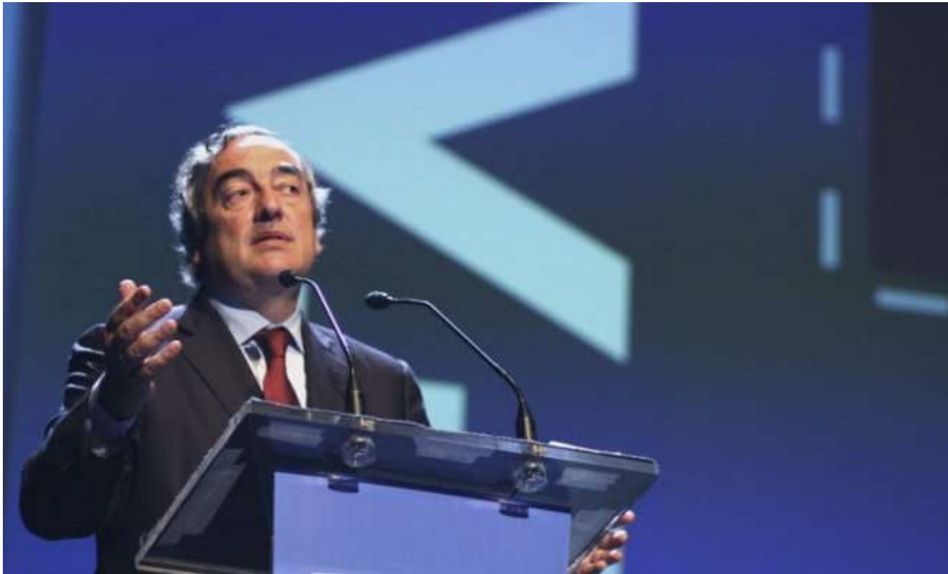
El presidente de la CEOE, Juan Rosell.

La guía pretende “trasladar a las empresas una idea clara, práctica y esquemática” del sistema concursal y ser “una herramienta didáctica para dar a conocer a empresarios y consultores los mecanismos que aplicar en los momentos más difíciles”.