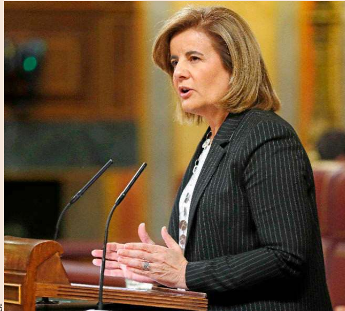
La ministra de Empleo y Seguridad Social, Fátima Báñez.

Ayudas con asalariados La norma apunta que el autónomo no perderá estos beneficios en las cotizaciones sociales si contrata asalariados. Así se resuelve uno de los problemas que frena el crecimiento del negocio en los primeros años. También es muy importan-