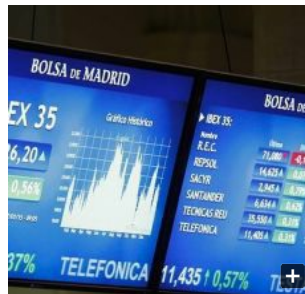
Los partícipes de planes de pensiones prefieren la renta variable

El futuro del actual sistema de pensiones tal y como lo conocemos está en riesgo -algunos le pronostican diez años de vida- y aquellos ciudadanos que deseen mantener su poder adquisitivo cuando se retiren tendrán que ahorrar para la jubilación. Estos mensajes emitidos por el Gobierno, expertos en Economía, consultoras o entidades financieras están penetrando en los ciudadanos y el patrimonio invertido en planes de pensiones está aumentando. Así lo recoge el Observatorio Inverco en su último informe, donde establece que el patrimonio medio invertido en planes de pensiones individuales en España aumentó un 4,5 por ciento en 2016, ya supera los 9.000 euros, y en los últimos cuatro años se incrementó un 38,2 por ciento. Navarra con 14.491 euros, País Vasco con 13.108 euros y Madrid con 11.630 son las comunidades donde el patrimonio medio de los partícipes es más elevado.