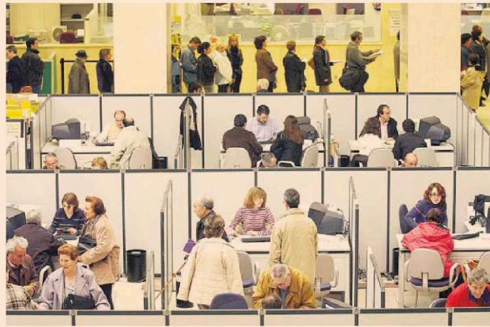
Sede central de la Agencia Tributaria, en Madrid.

DESDE 2015. Si vive de alquiler en la misma casa desde antes de 2015 y se ha deducido por este concepto, puede seguir deduciendo. Si cumple los límites de la base, conviene no cambiar de casa, utilizar las prórrogas y, si se terminan, firmar un contrato con el dueño del piso, incluso aunque modifique el importe y el plazo del contrato. Además, las comunidades autónomas suelen contar con deducciones específicas.