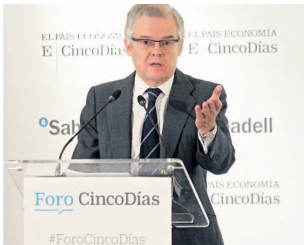
Sebastián Albella, presidente de la CNMV. PABLO MONGE

La primera comunicación de este tipo data del pasado 31 de octubre y corresponde a la gestora Unigest, propiedad de Unicaja, para el fondo Fondespaña-Duero Garantizado TFI/2022. La gestora avisa de que la valoración "representa el 106,7308% del valor liquidativo inicial [...] superando el objetivo de rentabilidad del 106,05% establecido en el folleto del fondo". En el comunicado, Unigest matiza que, "como consecuencia de cambios en las condiciones de mercado, el valor liquidativo del fondo podría volver a situarse por