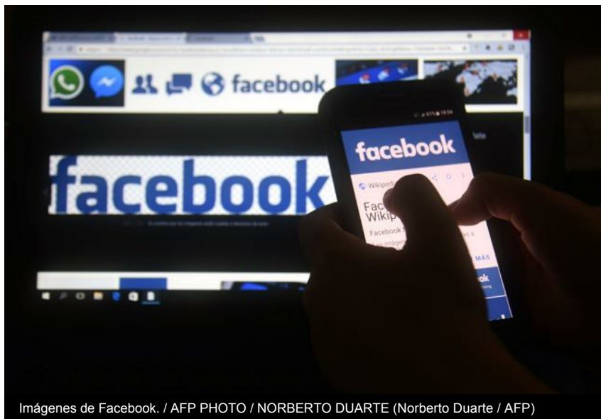
Imágenes de Facebook.