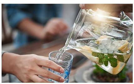
¿Qué debo beber para no deshidratarme? HolaDoctor