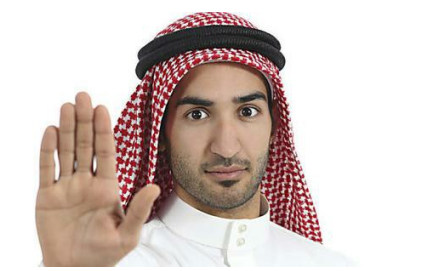
8 cosas cotidianas que en Arabia Saudita están prohibidas Viajes