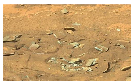
[Pics] 'Evidence of life on Mars' found in NASA Spirit rover Stunning images. Discoverytheword