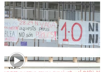
Estudiantes, profesores y bomberos se suman a las protestas en Cataluña