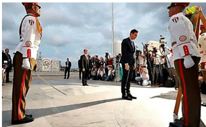
El diario 'El País' delira