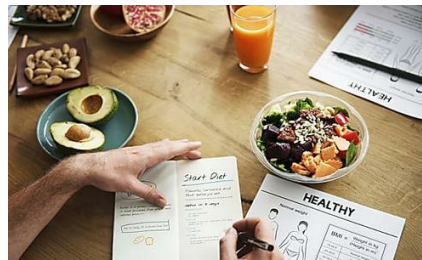
Dieta saludable = huesos sanos Hola Doctor