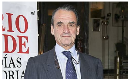
Mario Conde habla en televisión de su nueva novia, 27 años menor que él