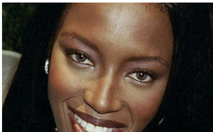
La novia de DiCaprio tiene 21 años ENFEMENINO