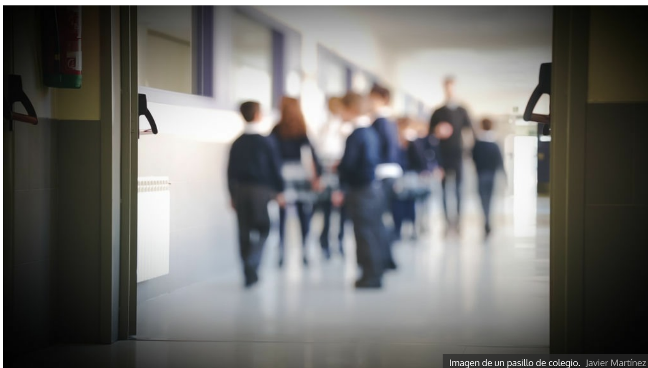
Imagen de un pasillo de colegio. Javier Martínez

Los padres no deben deducirse ese pago en la declaración de la renta como donaciones porque no lo son, y los colegios deben tributar por esos ingresos vía Impuesto de Sociedades