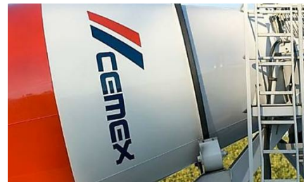
Cemex echa el cierre en Almería y Baleares: "Será la ruina para la comarca"