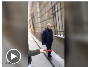
Militantes de Vox abuchean a Chaves y Griñán: "No hay pan para tanto chorizo"