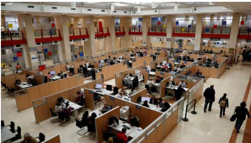
Hacienda entiende que las aportaciones a la escuela concertada no son donativos

El Registro de Economistas Asesores Fiscales (REAF) ha alertado hoy de que la Administración Tributaria (AEAT) está interpretando que los pagos que las familias hacen en las escuelas concertadas no se pueden considerar donativos y por tanto no son deducibles en la declaración de la renta.