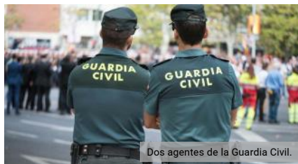
Dos agentes de la Guardia Civil.