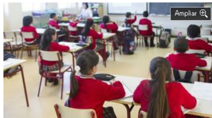
Colegio concertado.

La ministra de Hacienda, María Jesús Montero , ha confirmado este jueves que los padres también tendrán derecho a la devolución de las retenciones del IRPF ejercidas durante su permiso de paternidad. "Sí, claro. El IRPF se devolverá en los casos de paternidad igual que en los de maternidad", ha afirmado Montero.