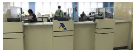
Hacienda rechaza que padres asturianos desgraven las donaciones a colegios concertados

La Agencia Tributaria ha empezado a exigir la devolución de las deducciones como donaciones realizadas por algunos padres en sus declaraciones de la renta por los pagos mensuales de la escolarización de sus hijos en colegios concertados al entender que hay una contraprestación y no un donativo en dichos pagos. Así lo ha señalado el director del servicio de estudios del REAF del Consejo General de Economistas (CGE), Rubén Gimeno, en una rueda de prensa para presentar las recomendaciones del CGE ante la Renta 2018, en la que ha detallado un caso concreto sucedido en el Principado de Asturias, en el que la delegación de la AEAT ha considerado que el donativo no es tal al haber una "contraprestación", y ha añadido que se han dado casos similares en otras provincias.