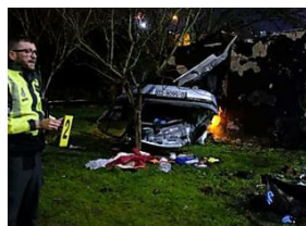
Muere una joven de 20 años al salirse su coche en San Martín y sobrevolar un talud 28 metros