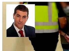
La abogada del 'rey del cachopo': "No defiendo asesinos. Si tengo la mínima sospecha, dejo la defensa"