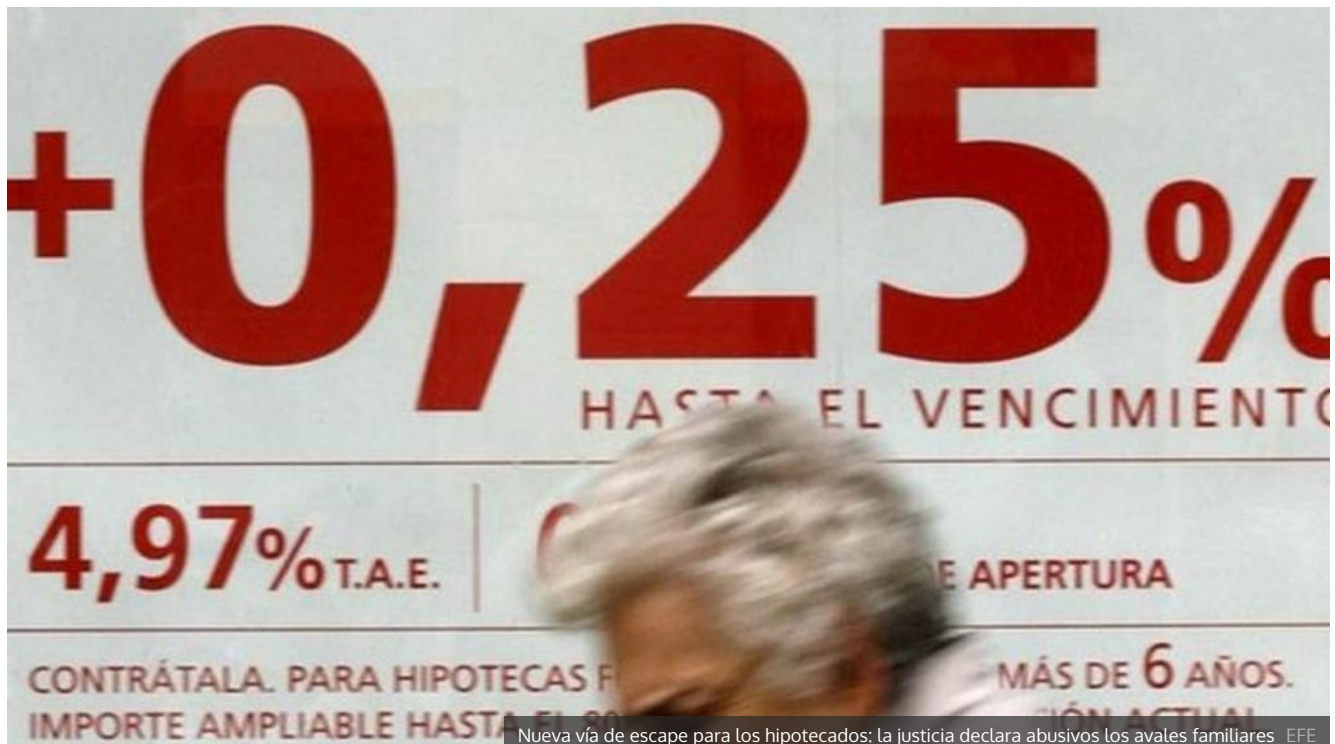
Nueva vía de escape para los hipotecados: la justicia declara abusivos los avales familiares EFE

Aunque el Gobierno decida por ley que es la banca la que debe pagar el tributo, el CGE cree que las entidades se lo repercutirán a sus clientes