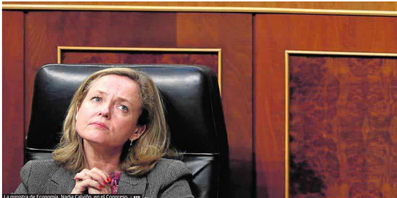
La ministra de Economía, Nadia Calviño, en el Congreso.