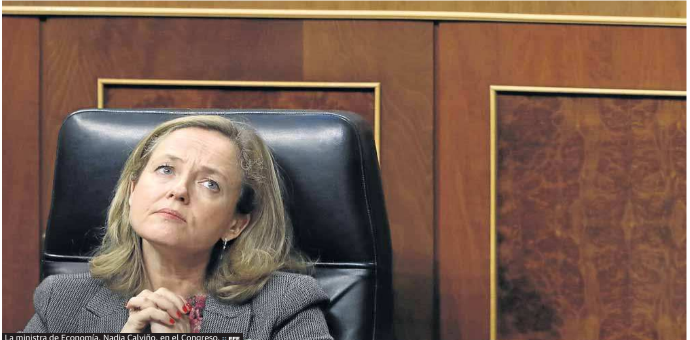
La ministra de Economía, Nadia Calviño, en el Congreso.

mediamente esta subida del salario mínimo provocará la destrucción de puestos de trabajo, desde otros como la propia OCDE alaban la medida tomada por el Gobierno y reivindican que es «necesaria y razonable» porque el salario mínimo era «muy bajo» y había que aproximarlo al sueldo medio de España. «Estamos hablando de un sueldo de 30 euros al día incluso con la subida», razonaba el secretario general de la OCDE, Ángel Gurría, en su visita a España hace un mes.