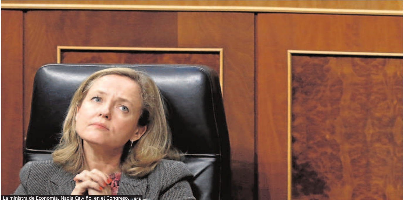
La ministra de Economía, Nadia Calviño, en el Congreso. ...

mediamente esta subida del salario mínimo provocará la destrucción de puestos de trabajo, desde otros como la propia OCDE alaban la medida tomada por el Gobierno y reivindican que es «necesaria y razonable» porque el salario mínimo era «muy bajo» y había que aproximarlo al sueldo medio de España. «Estamos hablando de un sueldo de 30 euros al día incluso con la subida», razonaba el secretario general de la OCDE, Ángel Gurría, en su visita a España hace un mes.