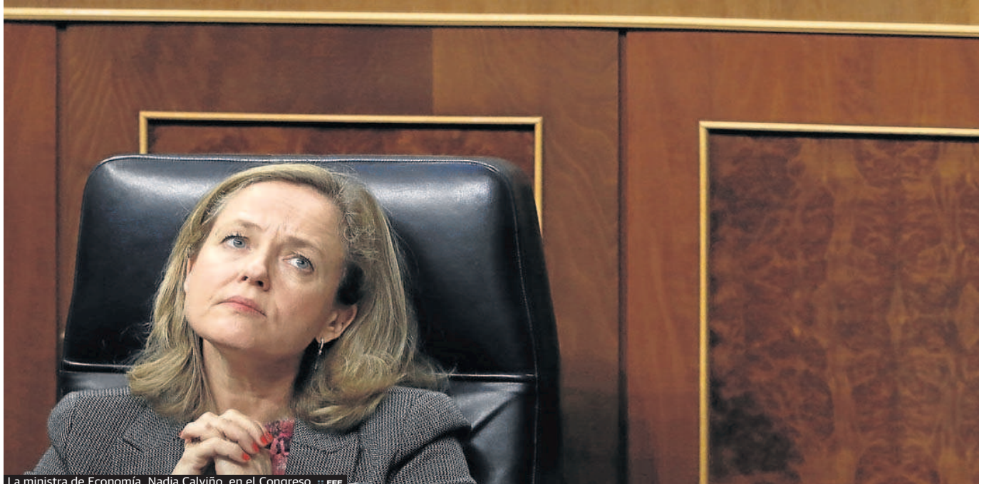
La ministra de Economía, Nadia Calviño, en el Congreso.

mediamente esta subida del salario mínimo provocará la destrucción de puestos de trabajo, desde otros como la propia OCDE alaban la medida tomada por el Gobierno y reivindicando que es «necesaria y razonable» porque el salario mínimo era «muy bajo» y había que aproximarlo al sueldo medio de España. «Estamos hablando de un sueldo de 30 euros al día incluso con la subida», razonaba el secretario general de la OCDE, Ángel Gurría, en su visita a España hace un mes.