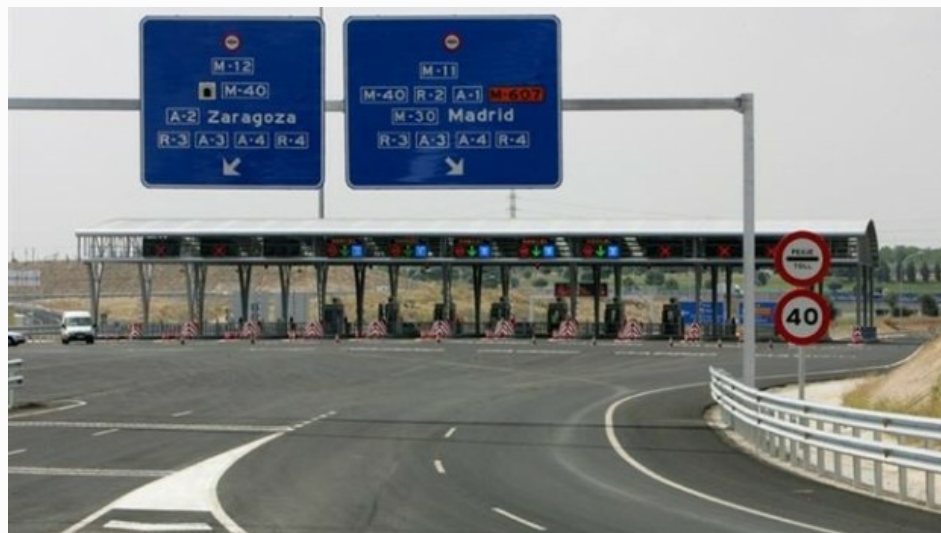
Autopista Eje Aeropuerto OHL

En un informe del Consejo General de Economistas insisten también en poner peajes en toda la red de autopistas