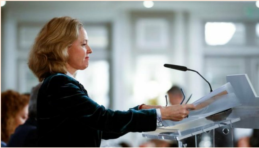
Nadia Calviño, ministra de Economía