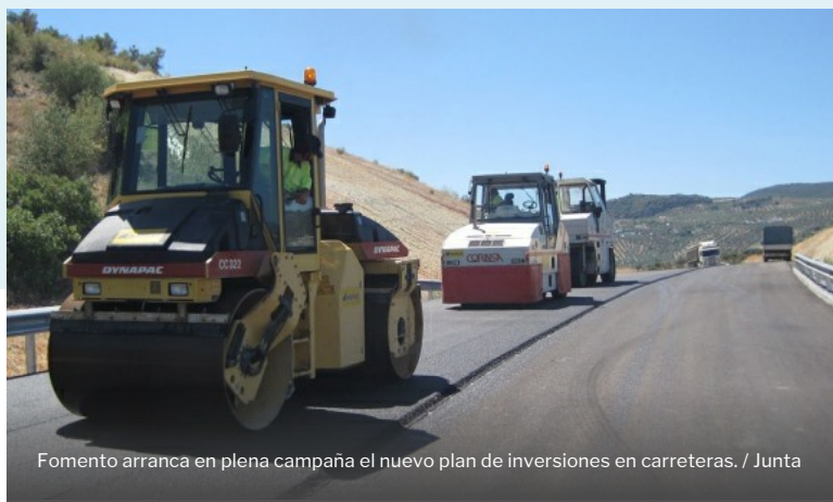
Fomento arranca en plena campaña el nuevo plan de inversiones en carreteras.

Fomento ha empezado a ejecutar el plan de carreteras de 1.000 millones que tirará de la colaboración público-privada durante este ejercicio. Y todo ello, en plena precampaña electoral para las municipales que se avecinan en próximo mes de marzo -con la posibilidad de que se adelanten las generales con los últimos hechos que rodean a los presupuestos-. Los primeros pasos que ha dado el Ejecutivo se han basado en someter a información pública el estudio de viabilidad de las obras de dos tramos de la A-7, la Autovía del Mediterráneo.