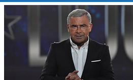
Jorge Javier Vázquez estalla contra Pablo Iglesias:...