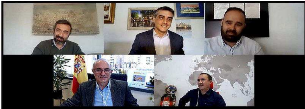
Expertos en internacionalización y empresarios de la región con presencia en el exterior compartieron sus conocimientos y experiencia en este foro.

mercado es estable aunque entre los obstáculos a resaltar cita la financiación ya que, en su caso, las operaciones pueden dilatarse de tres a cuatro meses hasta que pueden cobrarla.