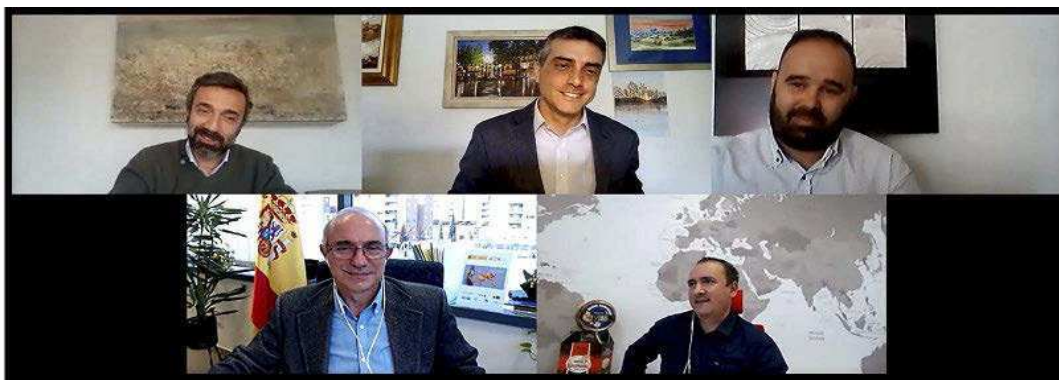
Expertos en internacionalización y empresarios de la región con presencia en el exterior compartieron sus conocimientos y experiencia en este foro.