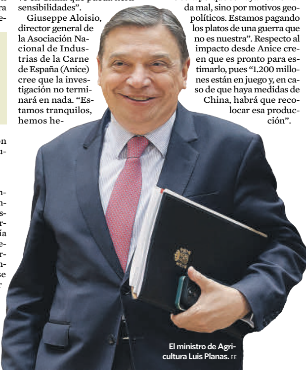
El ministro de Agricultura Luis Planas. EE

cho bien las cosas y hay una gran proactividad de aclarar la situación en bloque”. Aloisio explica que “desde ayer se abre el plazo para inscribirse en la investigación y las empresas responderán a los cuestionarios. Si llega alguna decisión no será porque se haya hecho nada mal, sino por motivos geopolíticos. Estamos pagando los platos de una guerra que no es nuestra”. Respecto al impacto desde Anice creen que es pronto para estimarlo, pues “1.200 millones están en juego y, en caso de que haya medidas de China, habrá que relocalizar esa producción”.