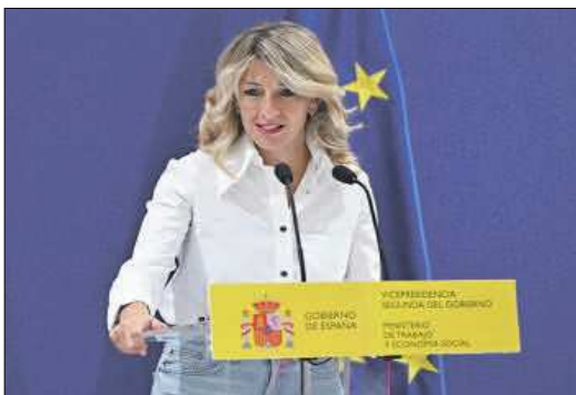
La vicepresidenta y ministra de Trabajo, Yolanda Díaz.

El retroceso se concentra en los servicios (-4,27%), mientras repunta en agricultura