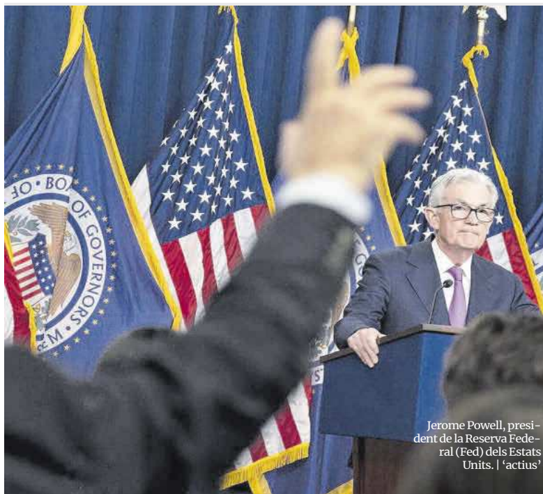
Jerome Powell, president de la Reserva Federal (Fed) dels Estats Units. | 'actius'

d'estudis Caixabank Research pronostica que continuarà baixant fins al 3,03% el desembre del 2024 i el 2,46% el desembre del 2025.