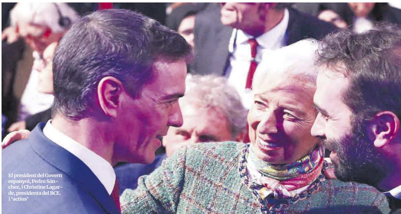
El president del Govern espanyol, Pedro Sánchez, i Christine Lagarde, presidenta del BCE. | 'actius'

L'auge (aparentment) imparable del turisme i el previsible camí de retallades en els tipus d'interès es disposen a prendre el comandament d'una economia espanyola que, a la tornada de l'estiu, s'enfronta al risc d'un escenari agreujat de paràlisi legislativa en el qual no es pot esperar que arribi un impuls important per part de les reformes normatives.